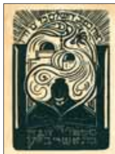
13 Channah (bat. Ascher) Blok maker onbekend, houtgravure circa 1930 Met Hebreeuws citaat: 'Zie het goede van Jeruzalem al de dagen van uw leven' (Psalm 128:5)