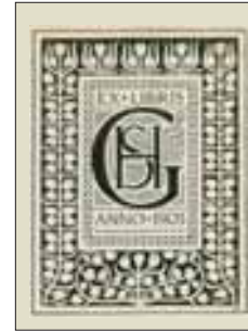
5 S. G[orter]-H[erz] J.Hanau, lijncliché 1903