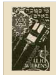
23 I.L.H. Wilkens arts G. Hilhorst, houtsnede 1936 Met Hebreeuws bijbelcitaat: 'Wie is als Gij, Eeuwige, onder de goden?' (Exodus 15:11)