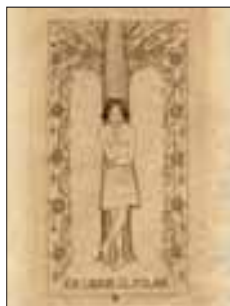
12 J.L. Polak E. Reitsma-Valença, kopergravure 1928