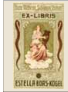
4 Estella Boas-Kogel maker onbekend, litho circa 1900 Een muze (?) met een citer, en in het Duits de toewijding aan 'het ware, schone en goede'.